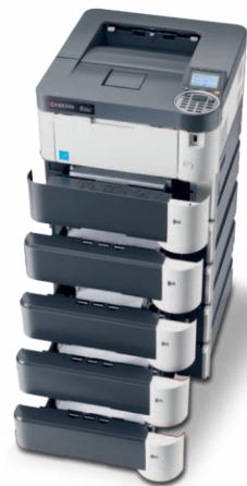
Produkt je zobrazen včetně volitelných doplňků.

JANUS spol. s r.o. – Sarajevská 8 – Praha 2 – tel.: 222 562 246 – fax: 222 563 255 www.janus.cz – info@janus.cz – KYOCERA Document Solutions Europe B.V. – www.kyoceradocumentsolutions.eu